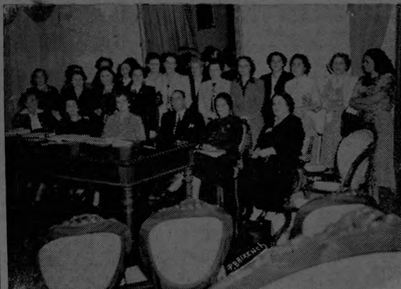
Foto tomada durante la sesión, en la cual vemos al señor Ministro de Relaciones Exteriores Lic. don Mario Echandi.

El viernes pasado, en la Casa Amarilla, se efectuó la reunión de la Comisión Interamericana de Mujeres.